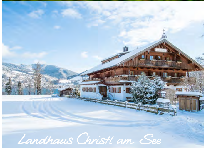
Landhaus Christl am See