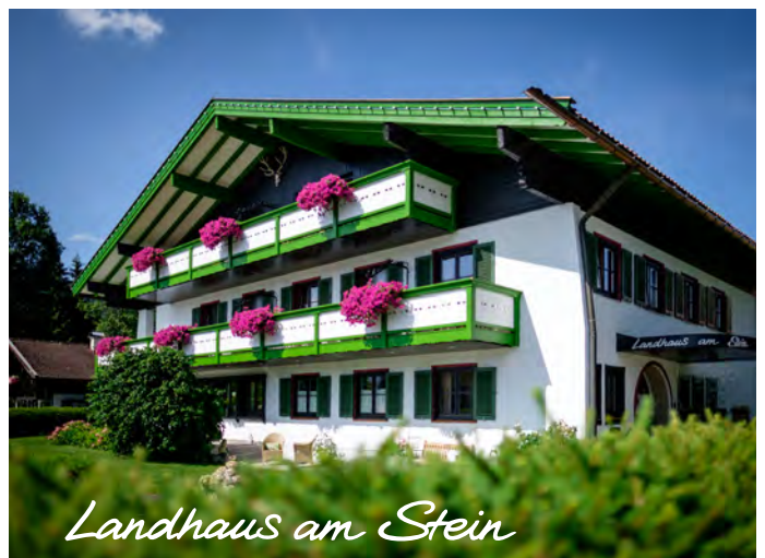
Landhaus am Stein

» 08022/18 80 890 · info@landhauschristl.de